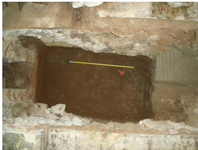
Vista final del sondeig.

Per sota del terra de la claveguera es va documentar un estrat d'argiles vermelloses (UE 109), sense presència de material ceràmic i amb una potència relativa que oscil·lava entre els 0,21 i 0,25 metres.