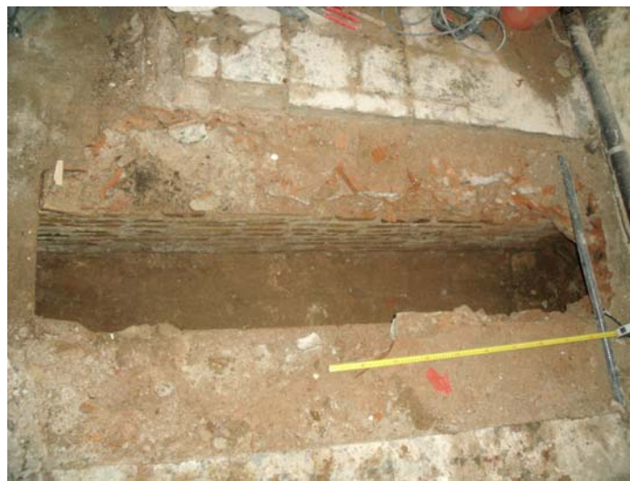
Vista de la claveguera (U.E 106).

El terra de la claveguera estava fet amb rajoles lligades amb morter de calç, i presentava una potència de 0,08 metres.