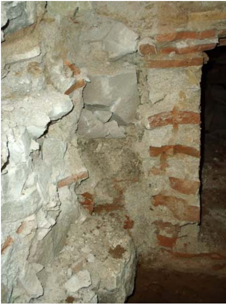
Vista de la UE 107, funcionant amb el mur de la claveguera.

Per sota del terra de la claveguera es va documentar un estrat d'argiles vermelloses (UE 109), sense presència de material ceràmic i amb una potència relativa que oscil·lava entre els 0,21 i 0,25 metres.