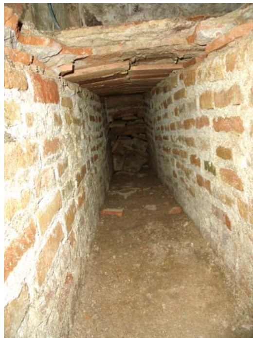
Vista de la claveguera (U.E.106), i la seva coberta (U.E. 105).

Per sota d'aquesta capa d'anivellació, hi havia una capa de morter de calç (U.E. 104), que s'estenia per tot el sondeig. Per sota van aparèixer dues filades de rajoles lligades amb morter de calç (U.E. 105) que corresponien a la coberta d'una claveguera (U.E. 106), aquesta coberta tenia un gruix de 0,12 metres.